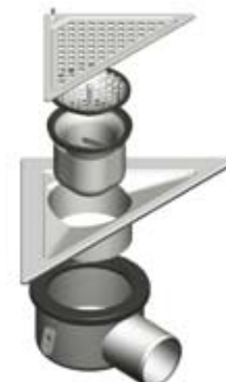
Afløb til bolig helt i rustfrit stål med ristelås