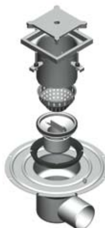
Afløb til industri helt i rustfrit stål med 2 kg rist