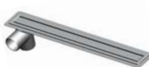
Eneste baderumsrender med rustfri vandlås