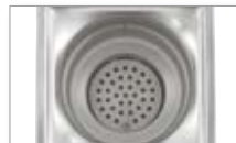
Fastskruet siplade i afløb type 760