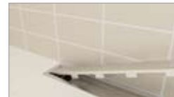
Sikring mod rotter med mekanisk ristelås