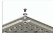
Riste fås med skruelås