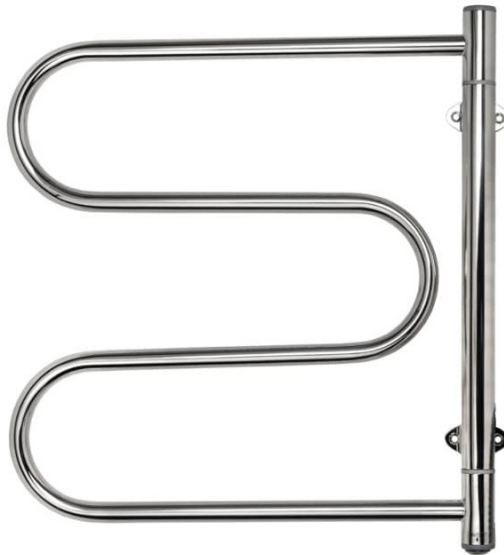
MR5552PE (45Watt) 550x520mm (HxB)

Følgende produkter er omfattet af nærværende dokument