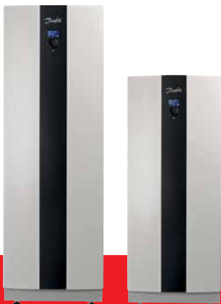
Jordvarmepumpe DHP Opti Pro +