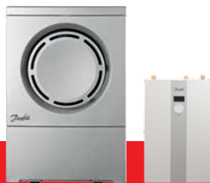
Luft/vand varmepumpe DHP AQ