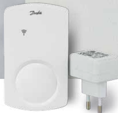
Repeater-enheder Danfoss Link™ RU

Ved at bruge repeater-enheder kan signalrækkevidden mellem den centrale styreenhed og installationerne udvides. Dette kan være nødvendigt på grund af en svag radioforbindelse forårsaget af store afstande, metalgenstande, særlige konstruktionsforhold mv.