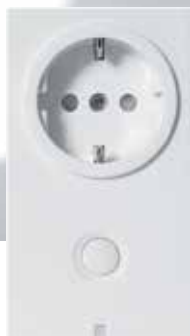
Relæ til stikdåse Danfoss Link™ PR