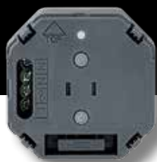
Indbyggningsrelæ Danfoss Link™ HR

Danfoss tilbyder en komplet portefølje, der gør det muligt at integrere og kontrollere elektriske enheder. Enten et indbygningsrelæ eller stikkontaktrelæ, som begge giver nem tilslutning af elektriske apparater, der kan aktiveres og tidsstyres via en tænd/sluk-funktion på Danfoss Link™ CC .