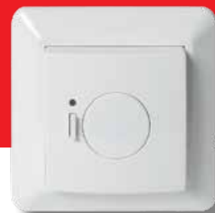
Gulvføler Danfoss Link ™ FT