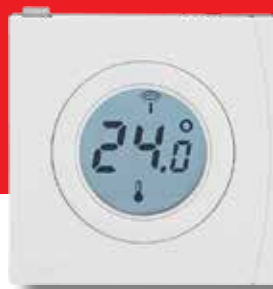
Rumtemperaturføler Danfoss Link ™ RS