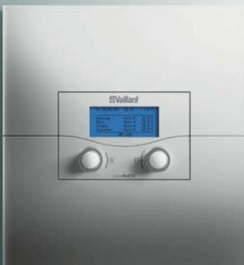
calorMATIC 630 til kaskadeanlæg.