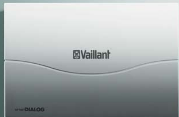
vrnetDIALOG - overvåger dit varmeanlæg.

calorMATIC 630 er styringen til kaskadeanlæg. calorMATIC 630 kan styre op til 6 kedler i kaskade og helt op til 15 varmekredse.