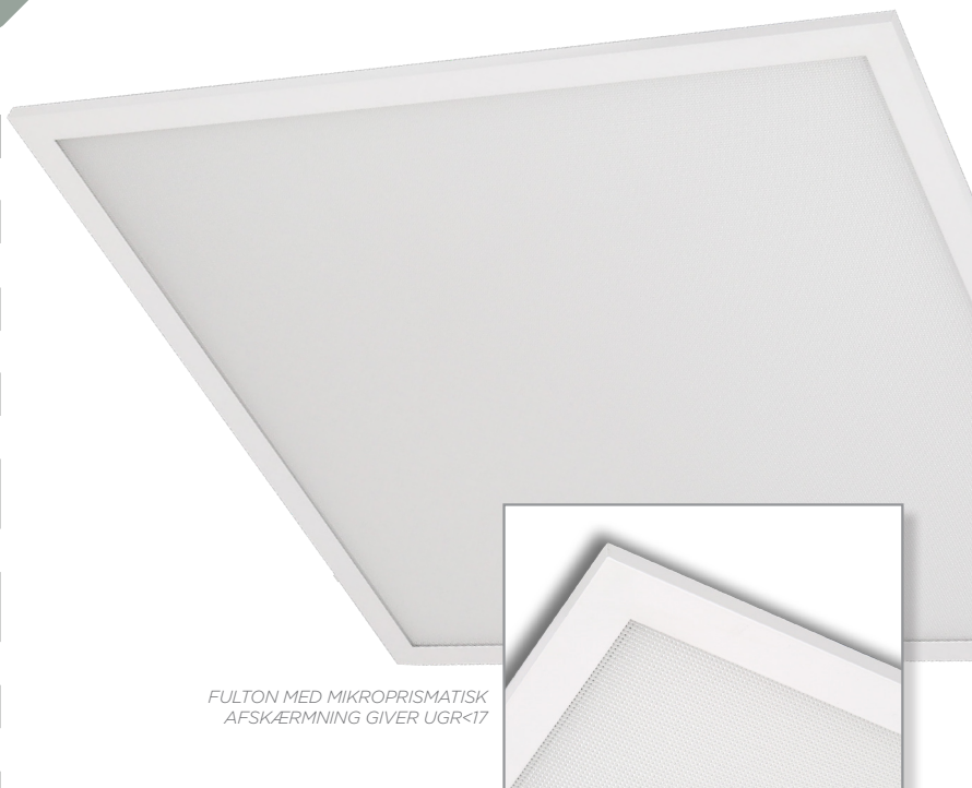
FULTON MED MIKROPRISMATISK AFSKÆRMNING GIVER UGR<17

FULTON MIKROPRISMATISK (MP) er et effektivt og elegant LED panel, som er egnet til især kontorer, skoler og institutioner - steder, hvor der stilles krav til produkternes specifikationer.