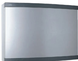
Kabinet til Termix Konv. 24

Konverteringsrørsættet gør det muligt at konvertere en Termix 20 til en Termix One eller Termix Novi.