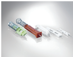
Resortes para aplicaciones médicas: Resortes de alambre con recubrimiento Bezinal® XC o XP para alto rendimiento, aleaciones de acero inoxidable de la máxima calidad y gran adaptabilidad