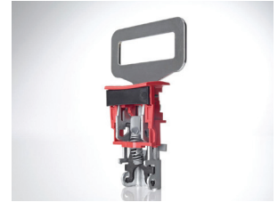
Resortes para cinturón de seguridad: buena tensión y resistencia al enrollamiento