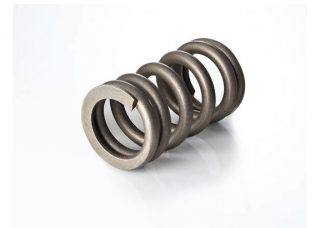
Resortes para válvulas: rígidos, fuertes y livianos