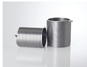
Resortes para lavadoras: alambre rectangular: mayor área de contacto para generar más fricción entre el resorte y el eje de impulsión