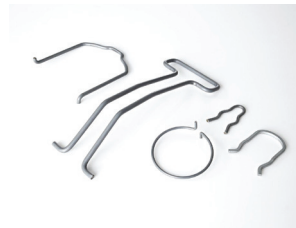
Alambres de formas y para ganchos: buena capacidad de deformación, devanado suave y reducción de puestas a punto.