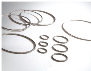
Retenes de aceite: fosfatados, galvanizados o inoxidables: buena resistencia a la corrosión, excelentes propiedades mecánicas