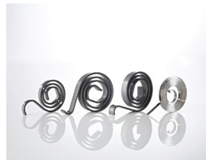
Resortes de tensión: una amplia variedad de tamaños y resistencias, con excelente resistencia a la fatiga