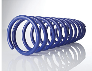
Resortes de suspensión: alta resistencia a impactos y dureza fiable