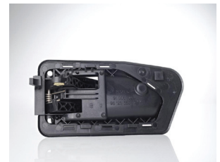
Resortes para frenos y cerraduras: Con recubrimiento Bezinal®: buena deformabilidad y alta resistencia a la corrosión