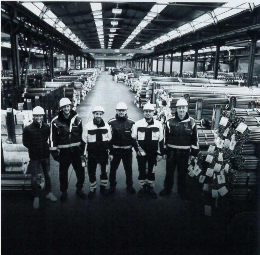
Nelle immagini: alcune fasi della lavorazione dell'acciaio e un gruppo di addetti

customisation and innovation, added to which the best in aesthetics and quality. The family run business over the last few years has introduced a strong managerial organisation and has initiated a project in the building and development of skills through new investment to set up the Rodacciai Academy, with training courses for operative resources and management. A training commitment that resulted in RodJob, an association promoted by Rodacciai with a network of local businesses "animated by a strong determination towards the development of young professionals ready to knowingly enter into the workplace". In what is "a company that has solid industrial bases, but a vision that crosses the narrow areas of the business world - reads a note - these qualities have brought Rodacciai to gain victory in the 2020 BtoB Awards, a prize given to local businesses, as well as obtaining the quality seal of Top Job 2021".