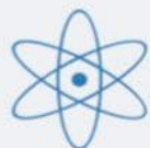
GENERAZIONE DI IONI