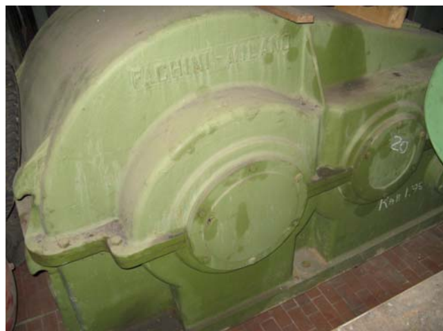
Ns. Codice - 113

Bobinatore verticale 2000kg con bobina idraulica scomponibile completo motore CC per filo Ø 2-10mm REVISIONATO