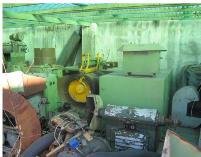
Ns. Codice – 164