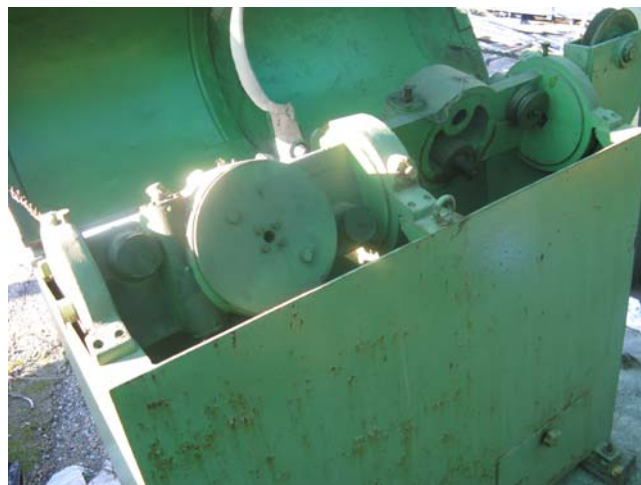
Ns. Codice – 169

Gruppo tenuta spira per monoblocco buttante.