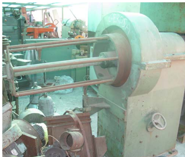
Ns. Codice - 165