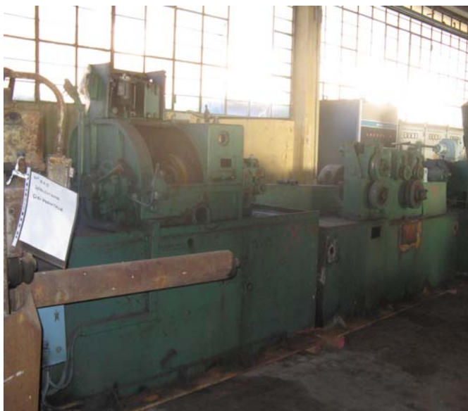
Ns. Codice – 161

Pelatrice daido completa di aspo svolgitore, preraddrizzatore, calandra con braccio di manovra.