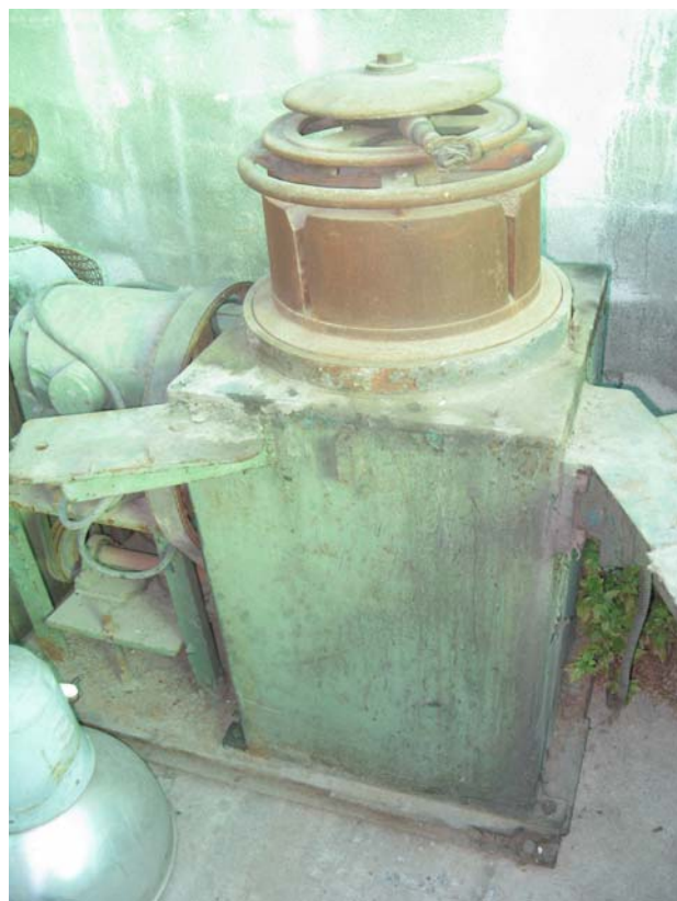
Ns. Codice – 167

Avvolgitore tipo tecnoimpianti (klimcolage).