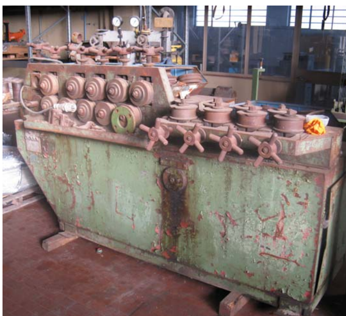
Ns. Codice – 163