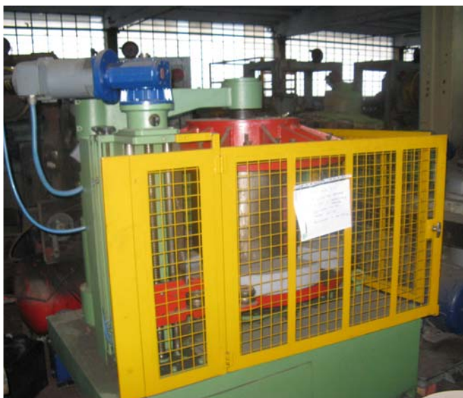
Ns. Codice - 15

Bobinatore verticale 2000kg con bobina idraulica scomponibile completo motore CC per filo Ø 2-10mm REVISIONATO