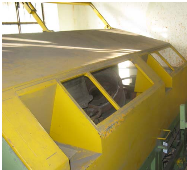
Ns. Codice – 157

Pelatrice daido completa di aspo svolgitore, preraddrizzatore, calandra con braccio di manovra.