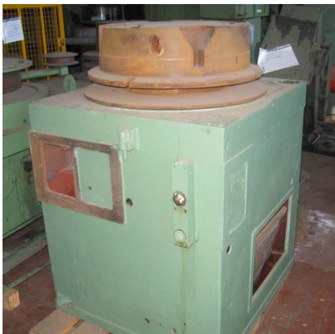
Ns. Codice - 150

Motoriduttore Faccini-Milano Rapporti -20-1.95