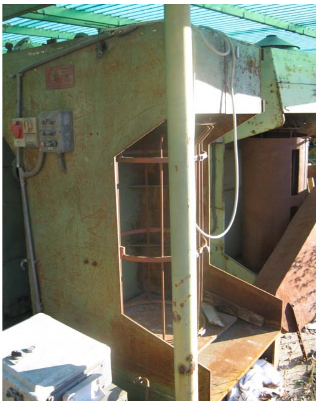
Ns. Codice – 166

Avvolgitore tipo tecnoimpianti (klimcolage).