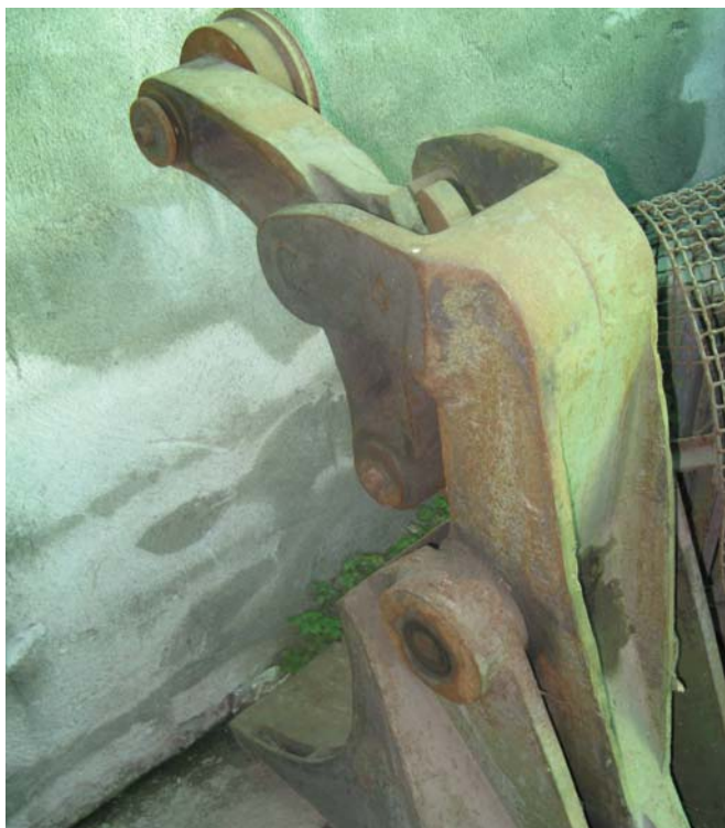
Ns. Codice – 168

Gruppo tenuta spira per monoblocco buttante.