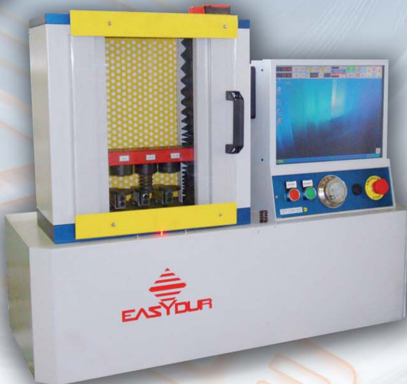
Mod. MICRODYNO - MAX 500N