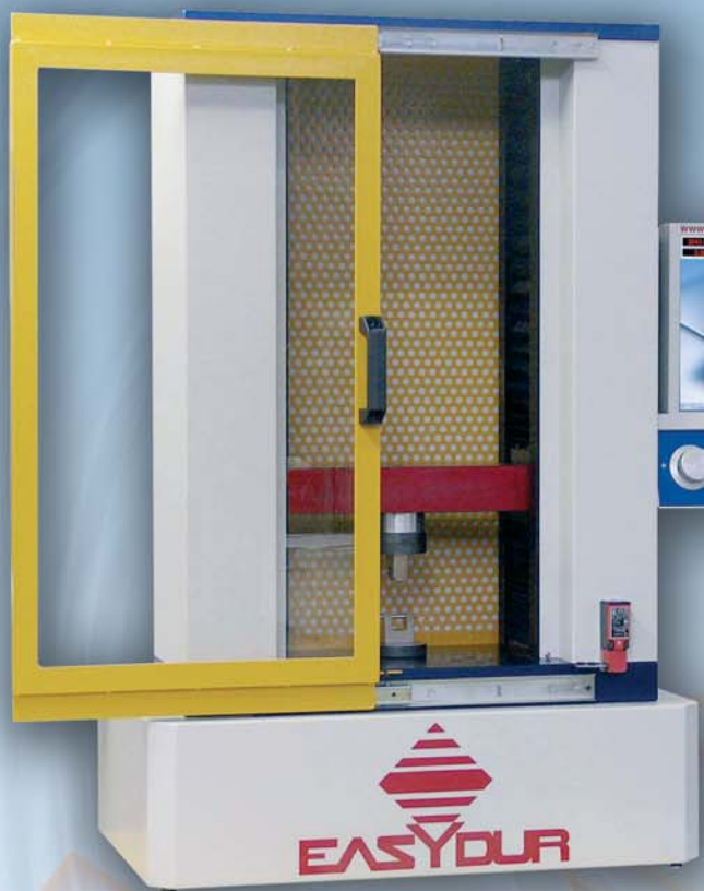
Mod. DYNO - MAX 5000N