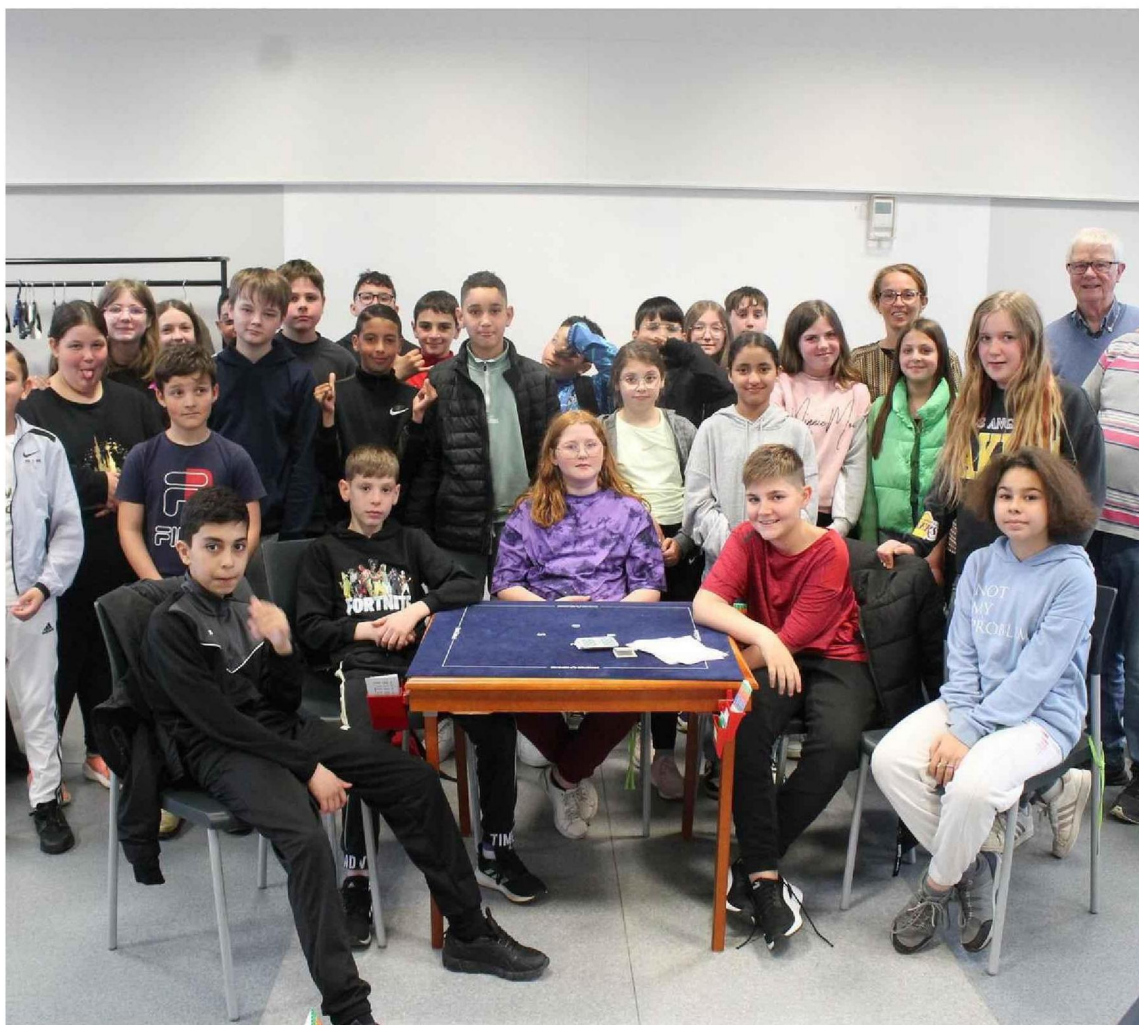
Les élèves de sixièmes, assidus au bridge. À la table, ceux qualifiés pour Strasbourg.

Depuis le début de l'année scolaire, Carine Legrand, professeure de mathématiques au collège Turgot, a mis en place un projet bridge dans le cadre du programme scolaire de mathématiques.