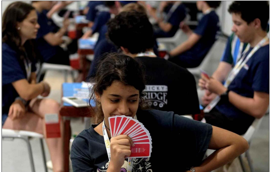
Stratégie, concentration et mental d'acier sont les armes sur lesquelles s'appuyer pour avoir une chance de remporter une médaille en finale des championnats de France scolaires et cadets de bridge ce week-end à Strasbourg.

Organisée traditionnellement à Paris, cette étape ultime des compétitions se poursuit ce dimanche. « Elle oppose 450 jeunes joueurs venus de tout le pays après avoir