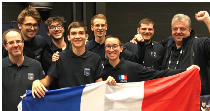
L'équipe de France U26 Open, championne d'Europe 2022.

En compétition, les USA et l'Europe dominent alternativement la planète bridge. Longtemps, les Italiens ont disputé aux Américains la suprématie mondiale, tandis que la France a fait cavalier seul dans les années 90. La Chine s'est affirmée depuis une vingtaine d'années comme une réelle puissance sur la scène internationale.