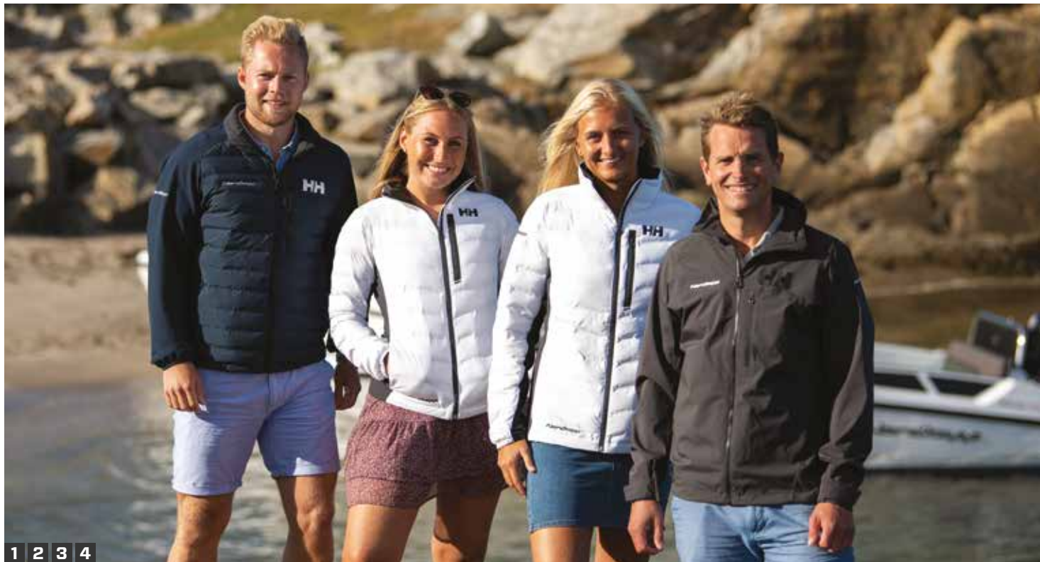
1 2 3 4