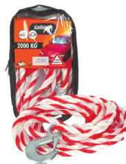
SLEPETAU Maks 2 tonn, 30 km/t. 1816