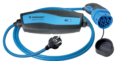
EKSTRA NØDLADER 10A med schucko stikkontakt. A707832