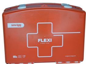
FØRSTEHJELPSKRIN Med festebrakett. PK0004