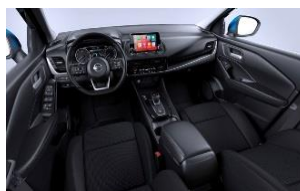
N-Connecta Charcoal - Monoform-seter i stoff