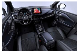
Tekna+ Blue Black - Monoform-seter i Premium skinn