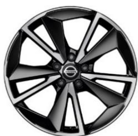
Tekna+ Tilvalg for N-Connecta & Tekna 19" alufelger (235/50 R19)