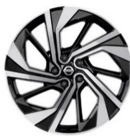
Tilvalg for Tekna+ 20" alufelger (235/45 R20)