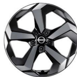
Acenta e-POWER, N-Connecta & Tekna 18" alufelger (235/55 R18)