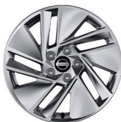
Acenta 17" alufelger (215/65 R17)