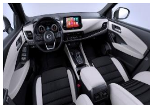
Tilvalg for Tekna Light Grey - Monoform-seter i stoff og Syntech-skin