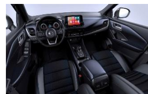
Tekna Blue Black - Monoform-seter i stoff og Syntech-skin