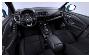
Visia & Acenta Black - Monoform-seter i stoff