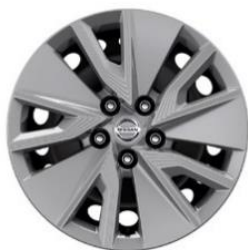
Visia 17" stål felger (215/65 R17)