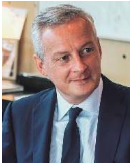
Bruno Le Maire , ministre de l'Économie, des Finances et de la Relance

La filière aéronautique, avec près de 300 000 emplois industriels, est un pilier de l'industrie française. Elle a été particulièrement impactée par la crise sanitaire compte tenu du coup d'arrêt massif et brutal porté au transport aérien. C'est pourquoi un plan de soutien sectoriel a été annoncé dès le 9 juin 2020, par Bruno Le Maire , ministre de l'Économie, des Finances et de la Relance.