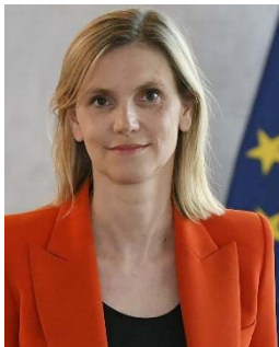
Agnès Pannier-Runacher , ministre déléguée chargée de l'Industrie

Un des enjeux de la relance de ce secteur réside dans le maintien de la faculté des entreprises à fabriquer les prochaines générations d'aéronefs bas carbone. Pour permettre à cette filière stratégique de rebondir après la crise, le Gouvernement a annoncé, dans le cadre de France Relance, le lancement d'un fonds de soutien aux investissements et d'accompagnement visant à accélérer la diversification, la modernisation et la transformation écologique de la filière aéronautique.