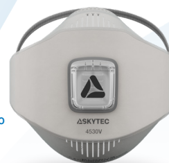
4530V FFP3 NR