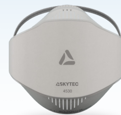
4530 FFP3 NR