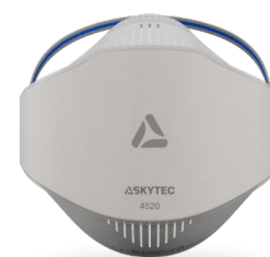
4520 FFP2 NR