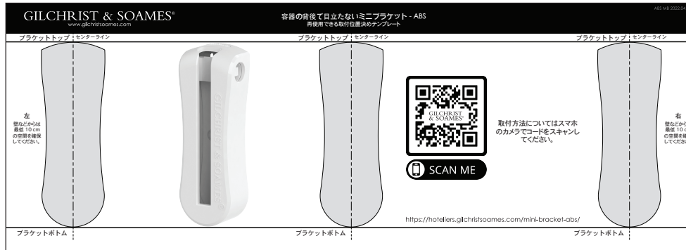
図 1: 再使用できる取付位置決めテンプレート (同梱)

テンプレートには、位置決めが簡単になるよう、ミニブラケットのセンターラインと上縁がマークされています。