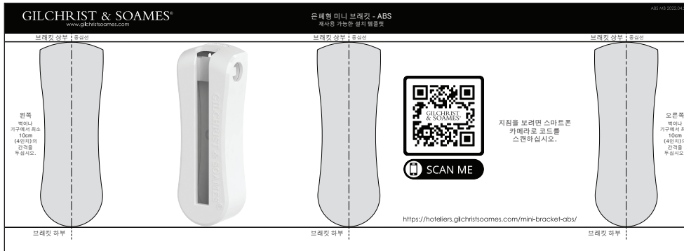
그림 1: 재사용 가능한 설치 템플릿(동봉)

브래킷을 벽에 맞출 수 있도록 브래킷 중심선과 브래킷 상부 가장자리가 포함되어 있습니다.