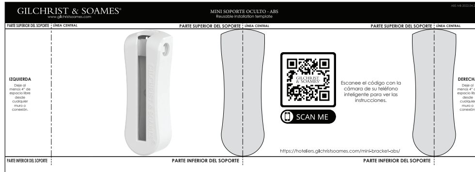
Ilustración 1: Plantilla de instalación reutilizable (incluida)

Por favor, tenga en cuenta que las líneas centrales del soporte y del borde superior del soporte están incluidas para ayudarle a alinear los soportes en la pared.