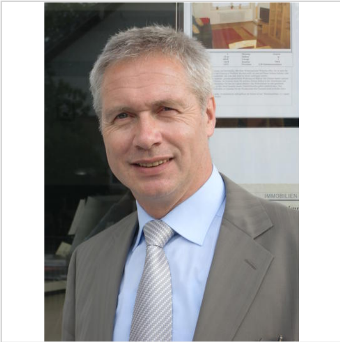
Verantwortlich: E.-W. Bruder