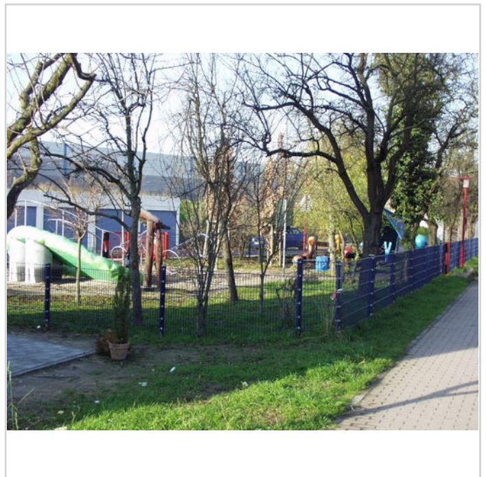
Hier könnten ihre Kinder spielen