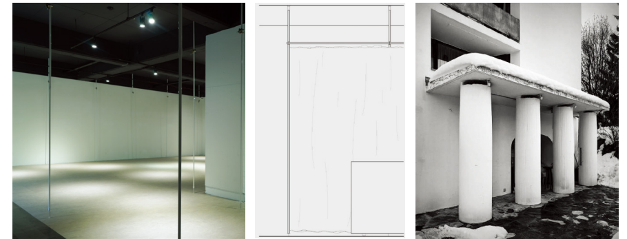
왼쪽부터 도판5 〈긴 지금(The Long Now)〉 설치 전경 2021 사진: 김건희 도판6 〈긴 지금(The Long Now)〉 전시 단면도 도판7 Casa Radulf. f © Rudolf Olgiati

좌대 위에 작품을 올리는 것에 유난히 조심스러웠던 정재경 작가의 영상 작업은 매체의 문제라고 할 수 있다. 초고화질의 시네마스케이프를 전제하는 작가는 본래 해당 작업이 좌대는 물론이거니와 작은