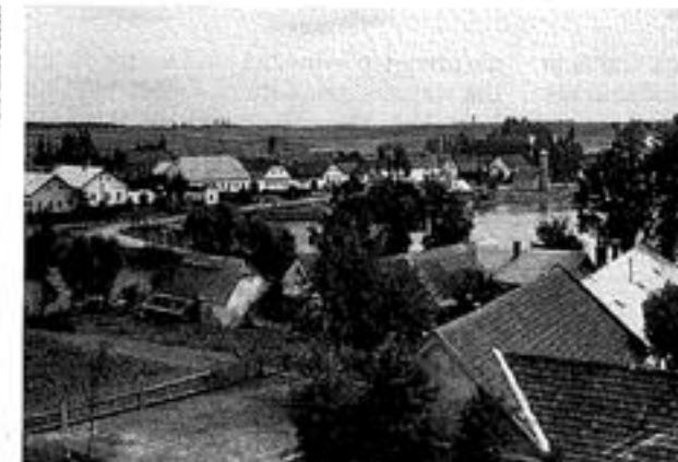
700 let – přiliš krátce na „domov můj“? (Dobronín dnes a za války)

naházeli do mělkých jam, ve tmě nehledali roztroušené kusy těl. Následující den musel jeden německý manželský pár dojít k místu vraždy a kusy lidského masa, mezi nimi i jednu celou paži, posbírat a zakopat.“ Když se zakrvácení vrazi vrátili do hospody, slavili až do nedělního rána. Louka, na níž se hrůzy odehrály, se