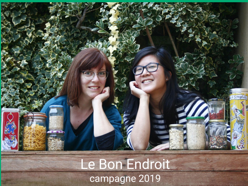
Le Bon Endroit campagne 2019