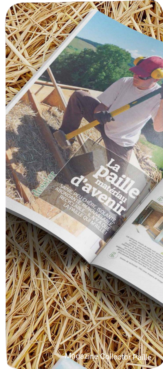
Magazine Collector Paille

POSTER MAUX D'ESPOIR POUR UTOPIA 56 - 43 préventes - 41 contributeurs | Société