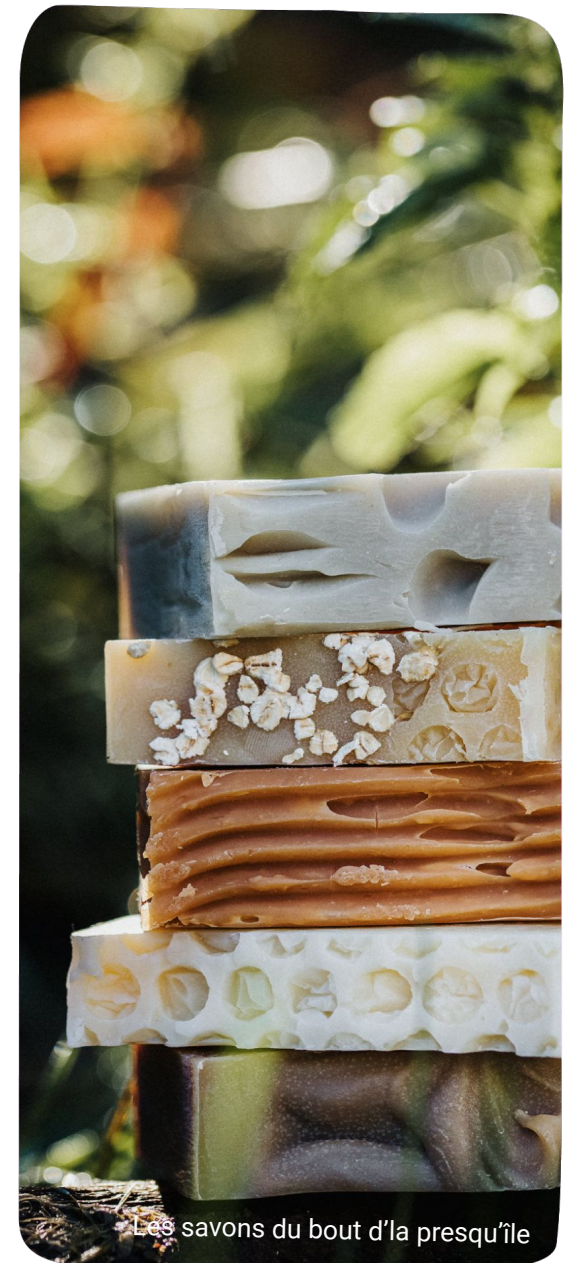
Les savons du bout d'la presqu'île

LES SAVONS DU BOUT D'LA PRESQU'ÎLE - 3 350 € collectés - 80 contributeurs | Écologie