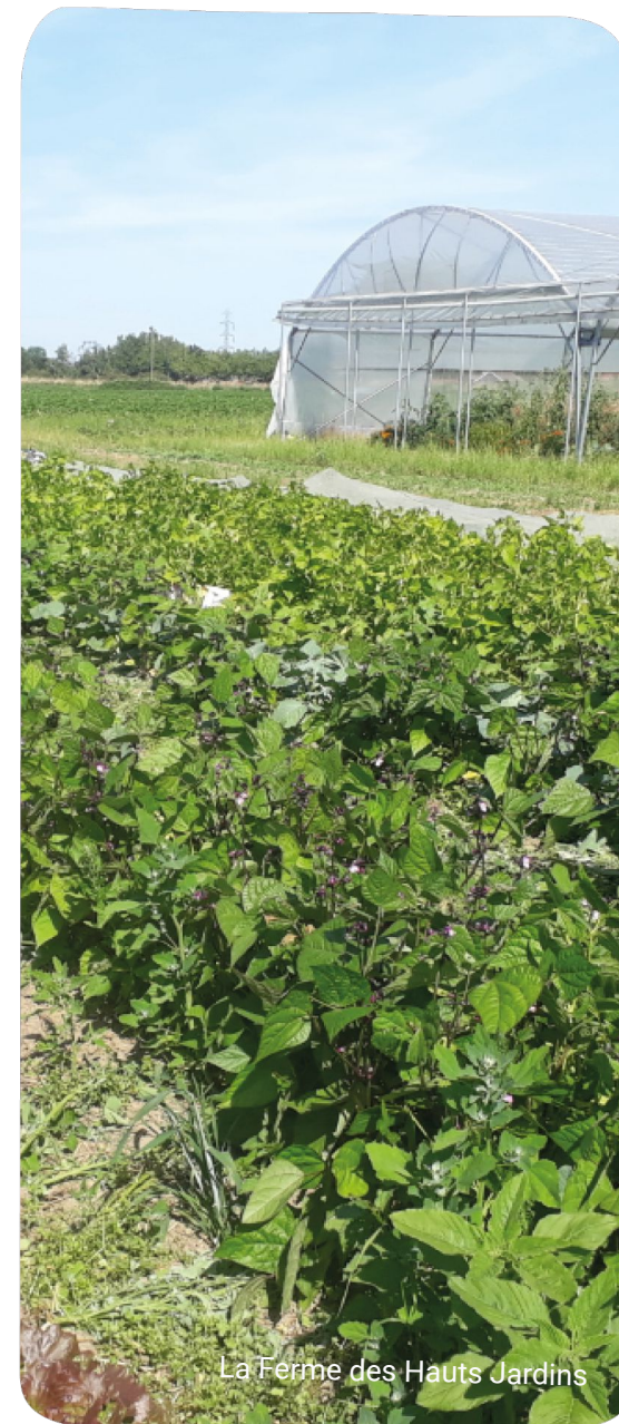
La Ferme des Hauts Jardins