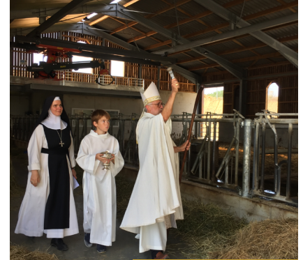
De gauche à droite : La grange cistercienne, les étables et la bénédiction des étables avec mère abbesse et Mgr Lacombe.