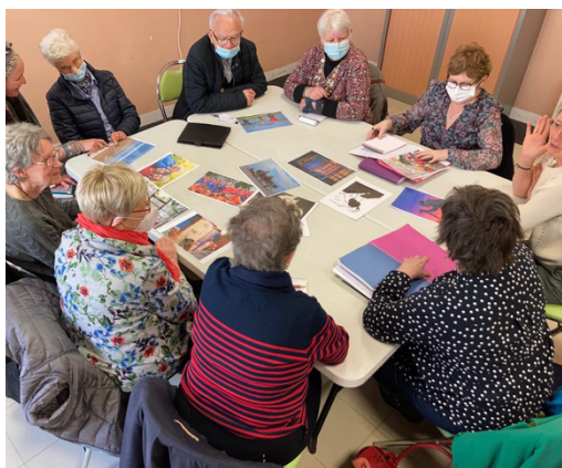
De gauche à droite : Le Béguinage Solidaire Hors-Les-Murs, réunion des futurs habitants ; La façade du Béguinage Solidaire de Valognes ; Travaux de toiture et charpente