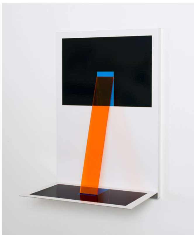
Théâtre #8, 2020 Photogramme / Tirage chromogène contrecollé sur aluminium, Plexiglas – 24 x 36 x 16,5 cm