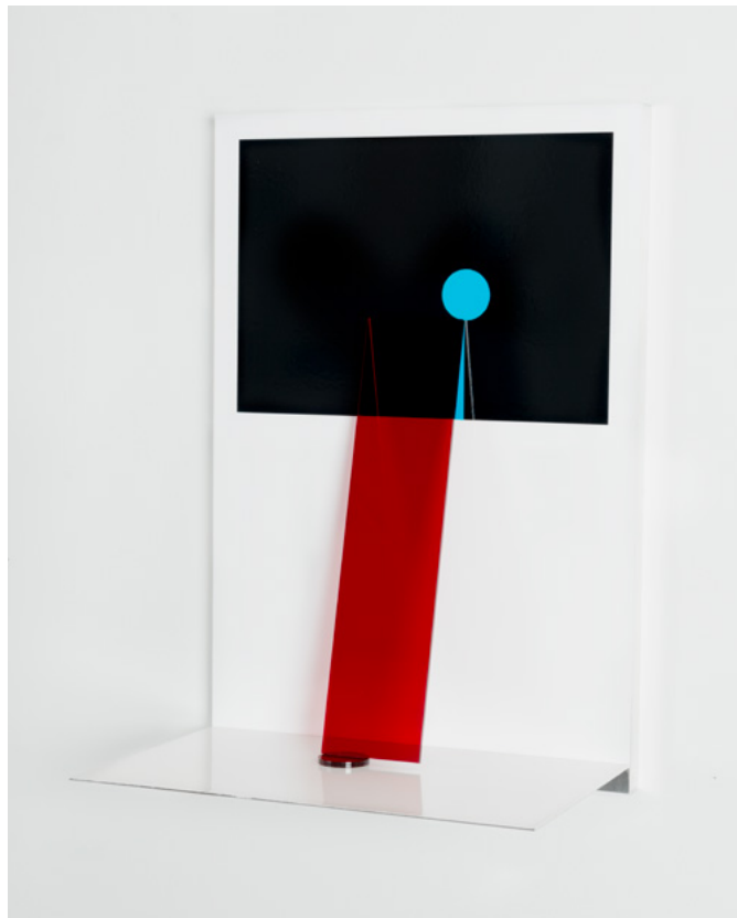
Théâtre #13 , 2020. Photogramme / Tirage chromogène contrecollé sur aluminium, Plexiglas – 24x36x16,5 cm ©Vincent Ballard, courtesy Galerie Lumière des roses

Avec la série Théâtres , dont le titre fait écho aux Teatrini de Lucio Fontana, Vincent Ballard déploie ses dernières recherches autour du photogramme. Dans le sillage des artistes minimalistes américains, il a recours à des formes géométriques simples et des couleurs primaires, mais c'est dans un mouvement très contemporain qu'il sort la photographie de son cadre pour la confronter à l'espace tridimensionnel. Concrètement, ce travail est réalisé sur un papier argentique couleur, à l'aide de morceaux de Plexiglas colorés, d'abord utilisés comme masques sous l'agrandisseur, puis associés au tirage pour former une œuvre en volume. Ce dispositif crée un effet subtil de profondeur qui retient l'œil et le piège, le jeu des couleurs inversées finissant de le désorienter. S'ensuit un trouble qui nous fait presque douter : s'agit-il bien de photographie ? C'est dans ce vacillement de nos perceptions que résident la force et le charme des œuvres de Vincent Ballard ; en déjouant nos habitudes visuelles, elles créent un espace intermédiaire entre réalité photographique et réalité intérieure qui ouvre les portes de l'imaginaire.