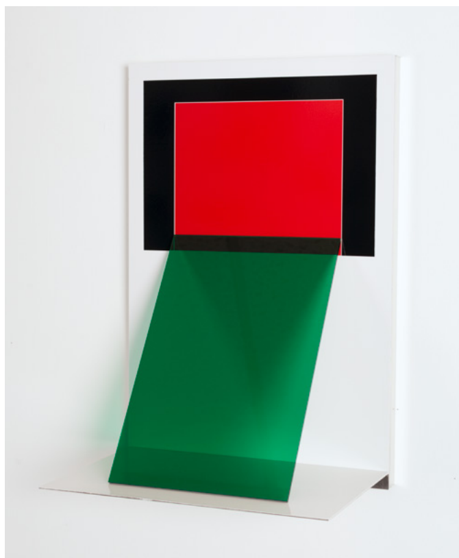
Théâtre #14, 2020 Photogramme / Tirage chromogène contrecollé sur aluminium, Plexiglas – 24x36x16,5 cm