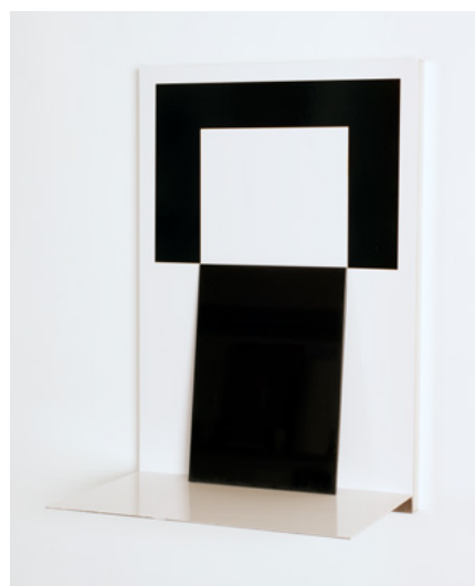
Théâtre #10, 2020 Photogramme / Tirage chromogène contrecollé sur aluminium, Plexiglas – 24x36x16,5 cm

Les visuels présents dans ce dossier sont disponibles pour la presse.