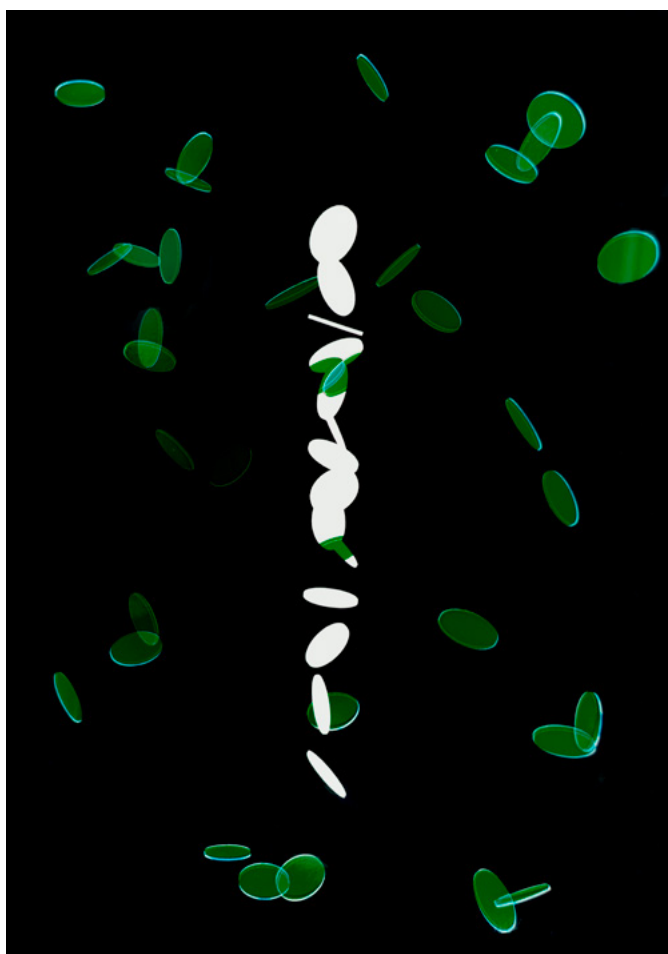
Jouer à pile ou face #4, 2020 Photogramme / Tirage chromogène - 45 x 60 cm ©Vincent Ballard, courtesy Galerie Lumière des roses

Six feet under , Cave du 4 rue Laussat, Pau