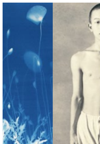
© Simone Kappeler, courtesy Galerie Lumière des roses/graphisme Zoé Barthélémy