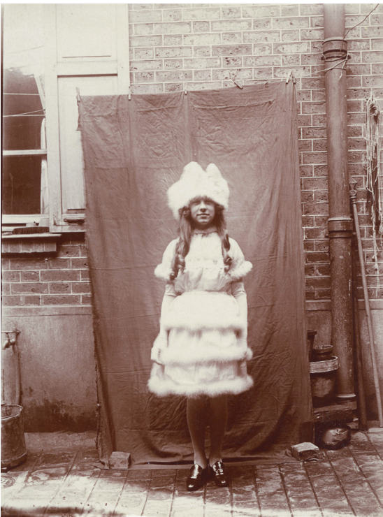
Photographe amateur France, vers 1890 Tirage aristotype – 11,3x8,3 cm © Courtesy Galerie Lumière des roses