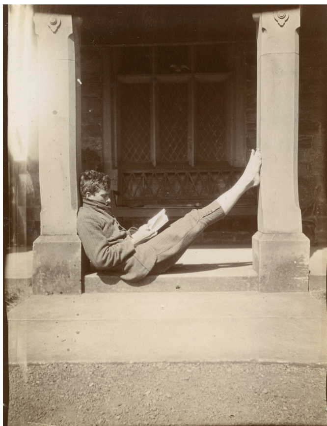
Photographe amateur États-Unis, vers 1900 Aristotype. 11,9x8 cm

Vernissage le samedi 11 mai de 14h à 20h