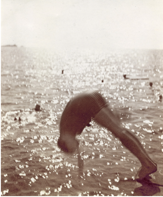
Photographe amateur France, vers 1900 Tirage aristotype – 9,5 x 7,8 cm © Courtesy Galerie Lumière des roses