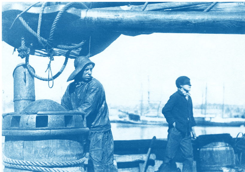
Photographe amateur France, vers 1890 Tirage cyanotype – 11,5 x 16,5 cm © Courtesy Galerie Lumière des roses

Pour obtenir les fichiers HD, écrivez-nous à contact@lumieredesroses.com