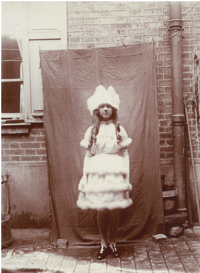
Photographe amateur France, vers 1890 Aristotype. 11,3x8,3cm

En ouvrant les boîtes où repose notre collecte amassée au fil des années, il a fallu à nouveau opérer un tri, vérifier si le temps de cette jachère n'avait pas émoussé l'éclat premier qui nous avait saisis. Après avoir remisé les nostalgiques, trait de caractère souvent associé aux images aux bords dentelés, les erreurs photographiques, les amusantes et autres mignonnes, une quarantaine de photographies sont apparues qui nous touchent par leur grâce, leur étrangeté, leur liberté. Celle-ci même revendiquée par André Kertész lorsqu'il disait : « Je suis un amateur et j'entends le rester. Regardez les amateurs dont le seul but est de recueillir un souvenir : voilà de la photographie pure ».