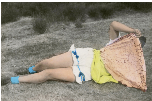
Photographe anonyme France, vers 1930-1940 Tirage argentique rehaussé à l'aquarelle

Pour obtenir les fichiers HD, écrivez-nous à contact@lumieredesroses.com