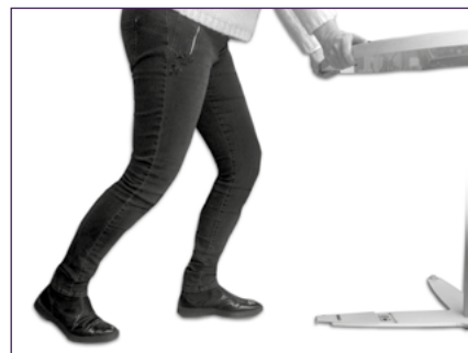
Déplacement facile en poussant