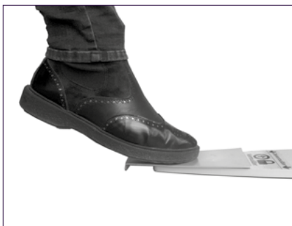
Déverrouillage au pied