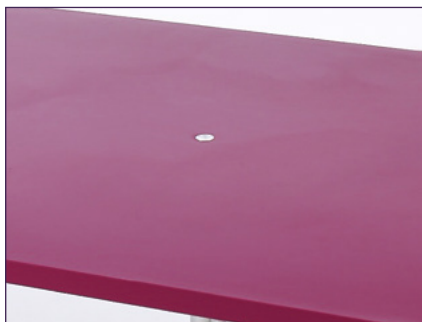
Bouton central pour régler la hauteur