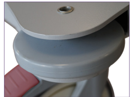
Galets anti-chocs, pas de traces sur les murs