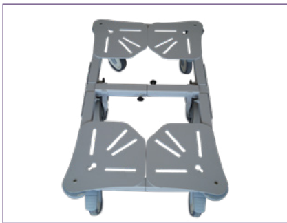
Longueur et largeur ajustables

Groom® facilite les poussées et les tirées de chariots pouvant atteindre jusqu'à 400kg. Allégeant considérablement les efforts requis, il diminue l'apparition des TMS .