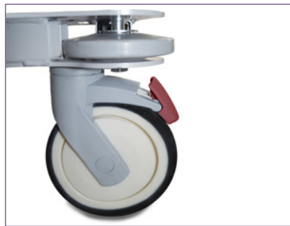
Roues anti-poussière (cheveux, fil sac poubelle, ...) et frein au pied