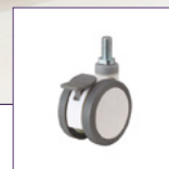
Roulettes double-galets disponibles