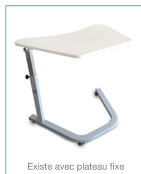
Existe avec plateau fixe

Roulettes de qualité Sécurisées (freinées à l'avant) Silencieuses (anti-vibrations) Longévité (anti-poussières, cheveux, fils)