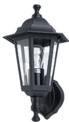
Slå lys av/på