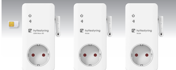
GSM Maxi 4G Sentralenhet

Innholdet i pakken varierer avhengig av om du har kjøpt GSM Maxi 4G Sentralenhet, GSM Maxi Node eller pakkeløsning med Sentralenhet og 2 Noder.