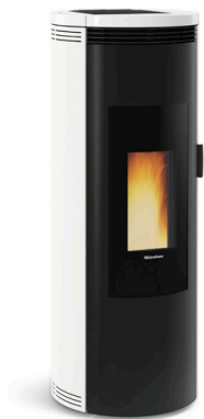
Start av pellets ovn

Den mest vanlige bruken av systemet er å knytte det opp mot en eller flere panelovner rundt om i hytta. Dersom tilkoblet ovn har termostat skal denne settes over valgt komfort verdi dersom den er koblet til en temperaturstyrt enhet, og på ønsket temperatur ved ankomst dersom den er koblet til en på/av enhet.