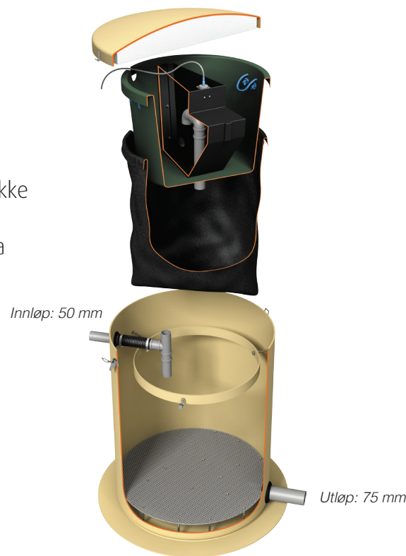
Vera Slamfilter for gråvann uten pumpe Varmekabel er ekstrautstyr.