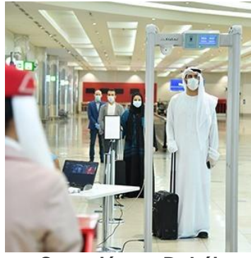
Conexión en Dubái