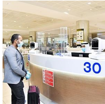
Salida de Dubái