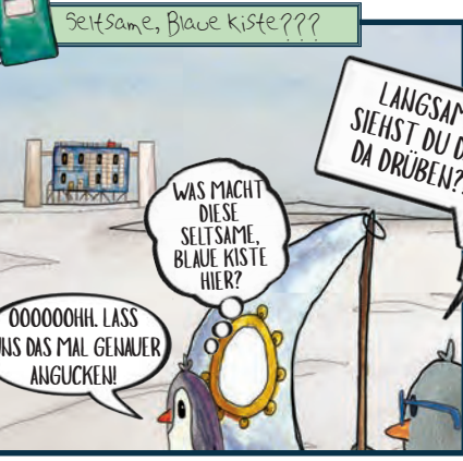
Seitame, Blaue Kiste???