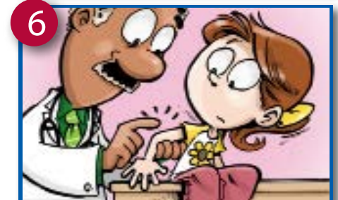
6 Bincshem be kum'te-wi ebo kelisi ke djiio eh-bifudzo sekitziuwde.