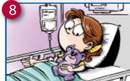
8 Ngu'u yi' emu' b'uo yiyeli bo nchagugu'u.