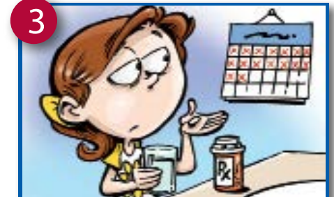
3 Kintusi ke'kole wi'h yikelumi, gen'e bil'umi-nt'i'in.