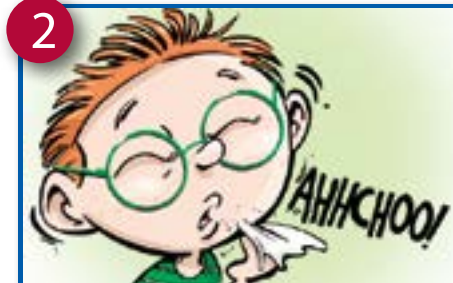
2 Kinfumten ki kwo w'e ime'yo yi kefew ke chi-ile, eyia nu dzee kint'on nu kibve..