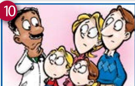
10 Wi'ih vu'b'uyi yi kvu de chemschem bu'o kincsem ke ngochi bosoge boyi'yele.