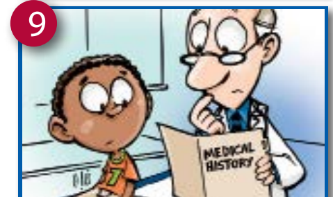
9 Bincshem b'h djichi nsaŋ wih, g'ii ewe keiti kintusi ekefiysi-ne kintusi ketemyi.