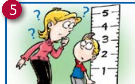
5 Mwem mi k'uoyi wi'ih (diyie binfumten, nguuy bo nyuo, bongu'oo).