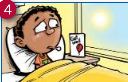
4 Entvunte ki temy'ih ke'nu gih ewih eyu'm kasse yiay-sen bu l'oehe ka'lo.