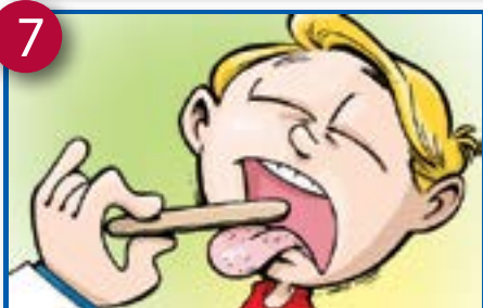
7 Didvele de yanseni ke kouo oue ye yiele ouo mw'em mu'eshi'm.