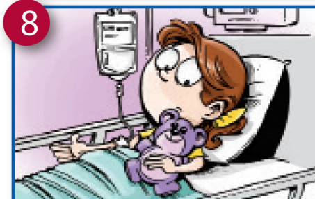
8 Haja kwa antibiotics intravenous kwa maambukizi ya wazi