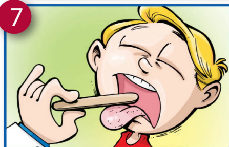
7 Kuendelea thrush mdimoni au maambukizi ya vimelea juu ya ngozi