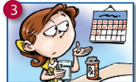
3 Miezi miwili au zaidi juu ya antibiotics na athari kidogo