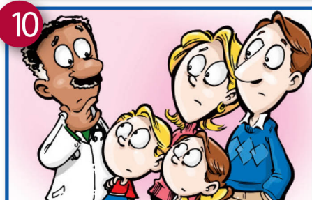
10 Okuba nga mu lulyo mulimu ekizibu ekyo