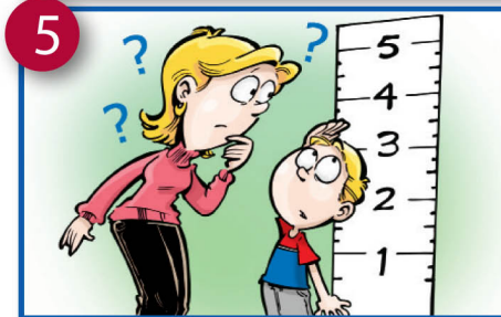
5 Kushindwa kwa watoto wachanga kupata uzito au kukua kawaida