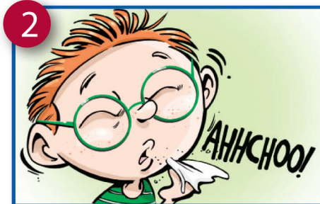
2 Mbili au mabaya zaidi sinus maambukizi ndani ya mwaka mmoja