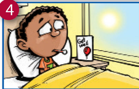
4 Mbili au zaidi nimonia ndani ya mwaka mmoja