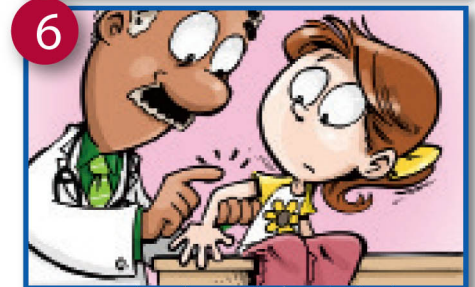
6 Matumizi ya kawaida , ngozi kirefu au chombo abscesses