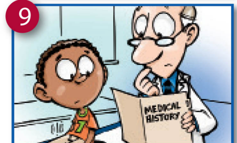
9 Mbili au zaidi maambukizi kina-ameketi ikiwa ni pamoja na septicaemia