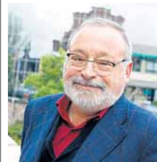
Filósofo Fernando Savater.