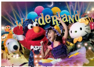
*รูปภาพตัวอย่าง