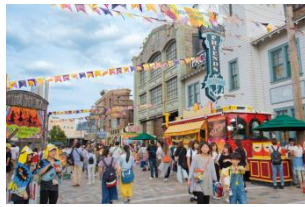
*รูปภาพของปีที่แล้ว

(สถานที่) New York Area (เวลา) 10.00 ~ 13.00 ~