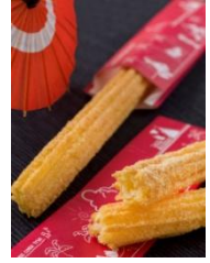
콩가루 추로스 400엔

※스페셜 메뉴의 판매 기간은 2019년 12월 26일(목)부터 2020년 1월 8일(수)까지입니다.