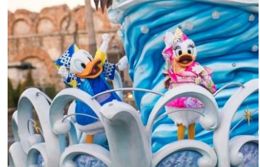
2018년 ‘뉴 이어즈 그리팅’

일본 전통 의상을 입은 미키마우스와 미니마우스를 비롯한 디즈니 친구들이 2020년을 축하하는 장식으로 꾸며진 배를 타고 게스트 여러분에게 새해 인사를 합니다.