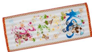
얼굴 수건(아마바리 타월) 1,500엔