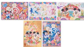
연하장 세트 630엔

2020년도 ‘쥐’의 해를 나타내는 글자인 ‘ね’를 가키조메하고 있는 미키마우스나 일본 전통 의상을 입은 디즈니 친구들이 디자인된 설날 아이템을 비롯하여 미키마우스를 모티브로 한 ‘달마’가 디자인된 아이템 등 약 60종류의 상품이 등장합니다.