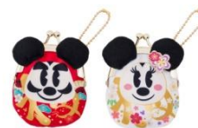
동전 지갑 세트 2,000엔