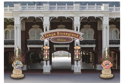
도쿄디즈니랜드 월드 바자의 입구 데코레이션

또한, 도쿄디즈니씨의 미라코스타 거리 입구에는 미키마우스와 미니마우스가 디자인된 가도마쓰가, 거리 안에는 일본 전통 의상을 입고 가키조메(書き初め: 새해 들어 처음으로 붓글씨를 쓰는 것)를 하는 붓을 들고 있는 미키마우스와 디즈니 친구들이 그려진 배너가 설치됩니다.