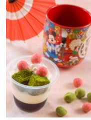
흰개 무스&흑설탕 시럽 젤리 기념컵 포함 800엔

일본 전통 의상을 입은 미키마우스, 미니마우스가 그려진 화려한 일본 찻잔 모양의 기념컵이 포함된 디저트를 판매합니다. 또한, 설날답게 일본의 전통적인 식재료를 사용한 콩가루 맛 추로스나 유자와 생강을 사용하여 차가운 몸을 따뜻하게 녹여주는 음료가 처음으로 등장합니다.