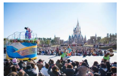
2019년 ‘뉴 이어즈 그리팅’