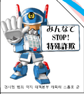
경시청 범죄 억제 대책본부 캐릭터 스톱호 군