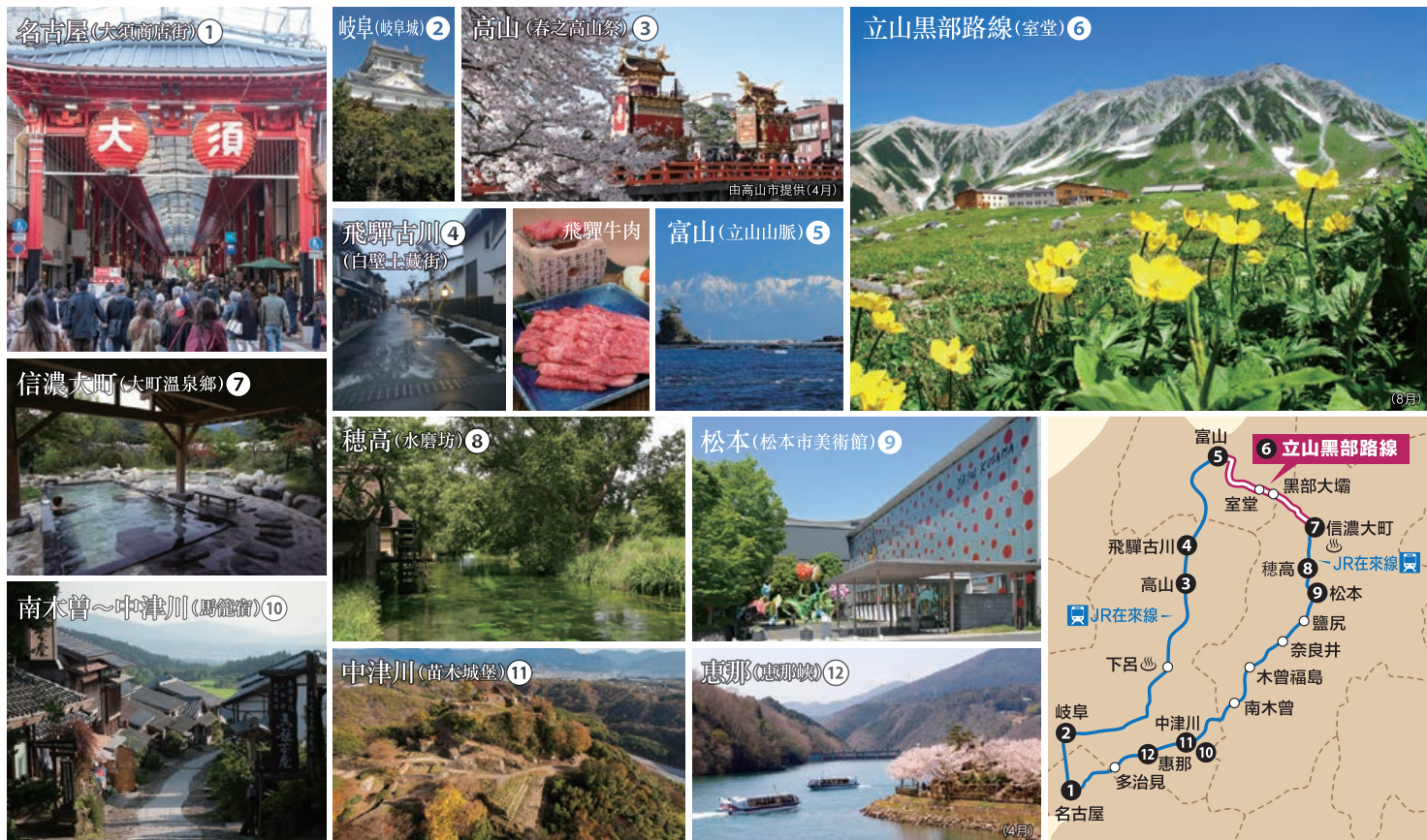
可搭乘的JR線、立山黑部 阿爾卑斯路線以及觀光地區的示意圖。記載的設施等可能需要另行支付入場費與交通費。