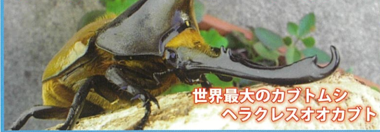
世界最大のカブトムシ ヘラクレスオオカブト