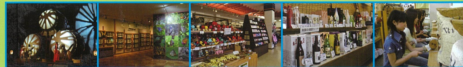
世界一の太鼓 | 世界の昆虫館 | お祭り市場 | せんべい焼き体験