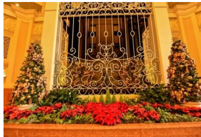
도쿄디즈니랜드 호텔의 데코레이션