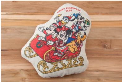
쿠션 2,300 엔

자세한 사항은 차후 도쿄디즈니리조트 오피셜 웹사이트에서 안내해 드리겠습니다.