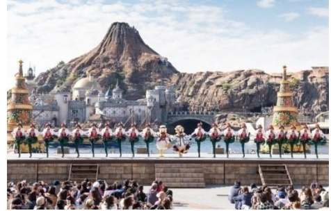
‘잇츠 크리스마스 타임!’

‘It’s Christmas Time!’이라고 적힌 배너가 하늘을 날고 포인세티아로 꾸민 아름다운 트리가 물 위에 서면 공연이 시작됩니다. 포근한 느낌의 하얀색을 기본으로 한 코스튬을 입은 미키마우스나 디즈니 친구들이 크리스마스를 함께 축하하기 위해 메디테러니언 하버에 모입니다.