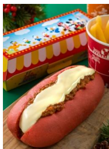
‘리프레시먼트 코너’ 스페셜 세트 990 엔