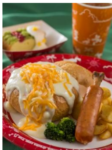
‘그랜마 사라의 키친’ 스페셜 세트 1,580 엔