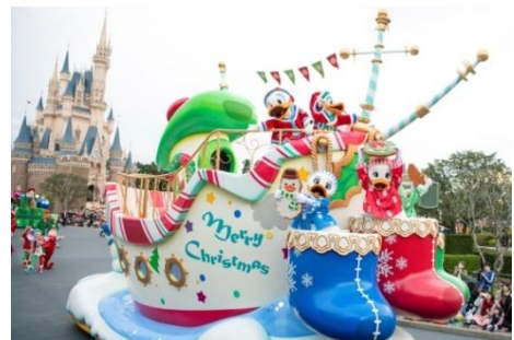
도쿄디즈니랜드 ‘디즈니 크리스마스’

또한, 밤이 되면 월드 바자 안 메인스트리트에서는 약 15미터 높이의 거대한 크리스마스트리를 중심으로 하여 영상과 음악을 이용한 크리스마스 기간 한정 연출을 실시합니다.