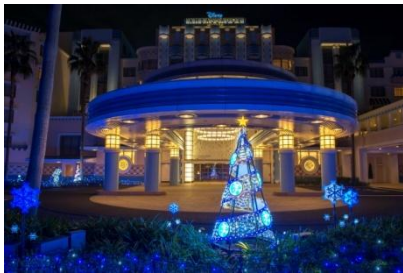
디즈니 엠버서더 호텔의 일루미네이션