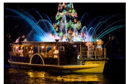
‘컬러 오브 크리스마스’

오랫동안 메디테러니언 하버 전체를 아름답고 밝게 꾸며 주었던 밤의 하버 쇼는 8년째인 올해를 끝으로 공연이 종료되며, 미키마우스를 비롯한 디즈니 친구들과 함께 도쿄디즈니씨의 밤을 낭만적으로 만들어 줍니다.