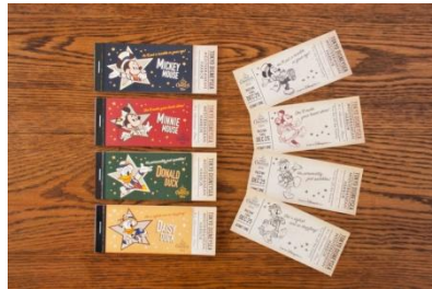
메모지 세트 1,000엔