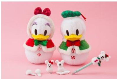
봉제인형 각 2,800 엔 헤어핀 세트 1,300 엔 볼펜 1,000 엔

자세한 사항은 차후 도쿄디즈니리조트 오피셜 웹사이트에서 안내해 드리겠습니다.