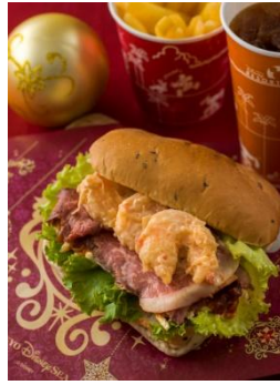
‘독사이드 다이너’ 스페셜 세트 1,240 엔