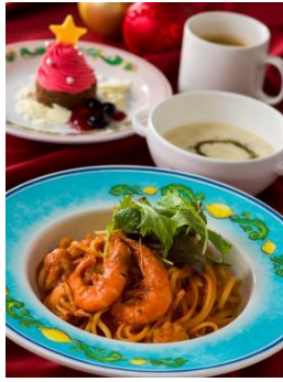
‘카페 포르토피노’ 스페셜 세트 1,920엔