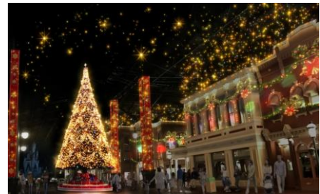
월드 바자의 밤 연출

월드 바자에 약 15미터 높이의 거대한 크리스마스트리가 등장합니다. 밤에는 크리스마스트리의 불빛과 영상이 어우러지며 변화하는 연출을 실시합니다. 음악과 빛에 둘러싸이는 낭만적인 분위기를 만끽하실 수 있습니다.