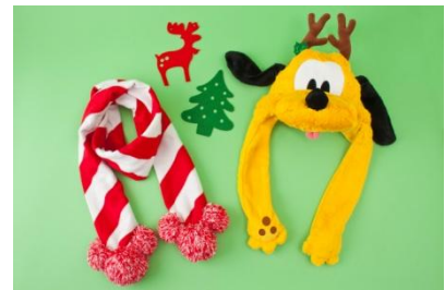
편캡 3,000 엔 목도리 2,900 엔