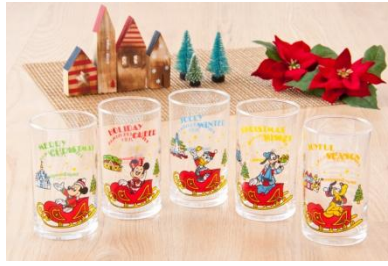
유리잔 세트 2,200 엔