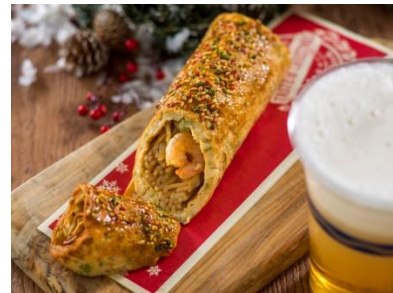
‘테이스트 오브 크리스마스’의 스페셜 메뉴

※스페셜 상품, 스페셜 메뉴의 내용은 예고 없이 변경되는 경우가 있습니다. 또한, 품절되거나 판매가 종료되는 경우가 있습니다.