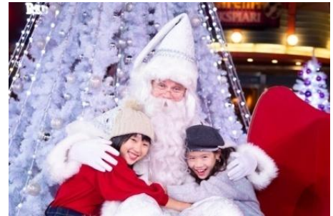
익스피어리 작년 크리스마스 이벤트 모습

마이하마역 앞의 상업 시설 익스피어리에서는 11월부터 크리스마스까지 크리스마스 이벤트를 개최합니다. 셀러브레이션 플라자에는 올해 익스피어리의 크리스마스를 상징하는 포토 스폿이 등장합니다. 상점과 레스토랑에서도 크리스마스에 선물하기 좋은 아이템과 이 시기에만 만나보실 수 있는 한정 메뉴 등을 준비합니다. 또한, 기간 한정으로 개최되는 워크숍(체험 강좌) 등 한층 더 신나는 휴일을 만들어 줄 이벤트를 다수 실시합니다.