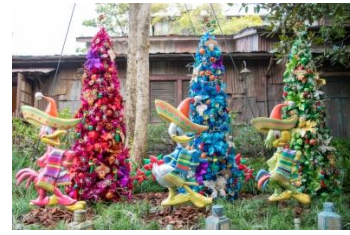
로스트 리버 델타