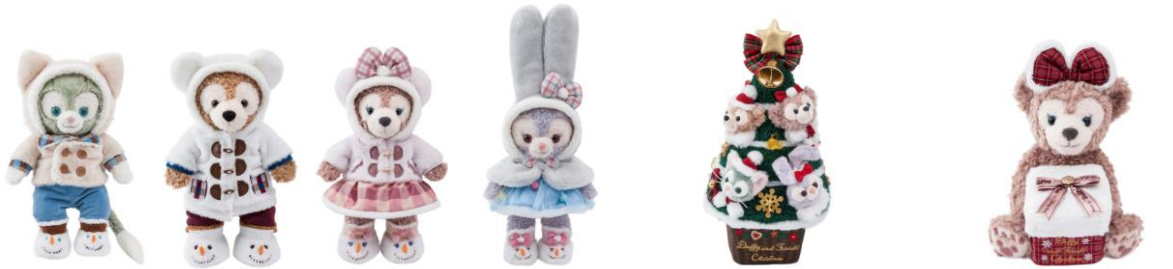
코스튬 세트 각 4,900 엔 ※봉제인형(S) 별도 판매.