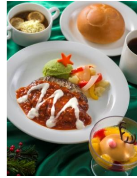
‘호라이즌 베이 레스토랑’ 스페셜 메뉴의 예 2,080 엔부터

또한, 올해도 아메리칸 워터프런트의 뉴욕 구역에서 푸드 프로그램 ‘테이스트 오브 크리스마스’를 개최합니다. ‘식사 전에 술과 간편식을 곁들여 대화를 즐기는 풍요로운 시간’을 보내실 수 있도록 이 계절에만 만나보실 수 있는 따뜻한 주류나 이에 딱 맞는 메뉴를 약 10종류 판매합니다.