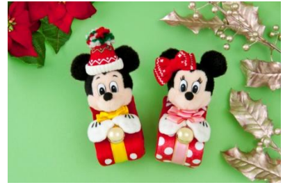
봉제인형 밴드 각 1,700 엔