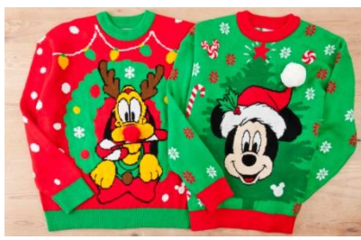
스웨터 각 5,900 엔