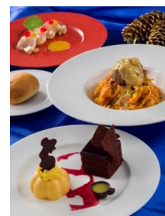
‘이스트 사이드 카페’ 스페셜 세트 2,800 엔

※스페셜 상품, 스페셜 메뉴의 내용은 예고 없이 변경되는 경우가 있습니다. 또한, 품절되거나 판매가 종료되는 경우가 있습니다.