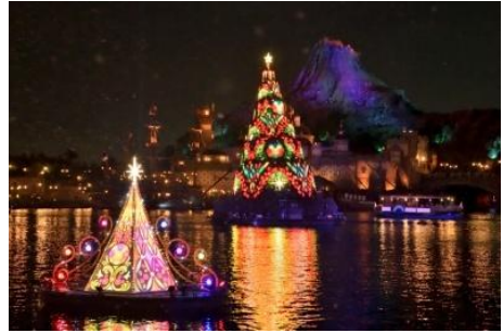
'컬러 오브 크리스마스 - 애프터 글로우'

크리스마스의 화려한 분위기로 가득한 메디테러니언 하버에서는 사람들의 소원이 모여 밝게 빛나는 크리스마스 트리와 작은 트리 장식물이 크리스마스 음악에 맞춰 반짝 반짝 색색의 빛을 발합니다. 일부 공연에서는 눈 내리는 연출이 더해져 낭만적인 분위기를 즐기실 수 있습니다.