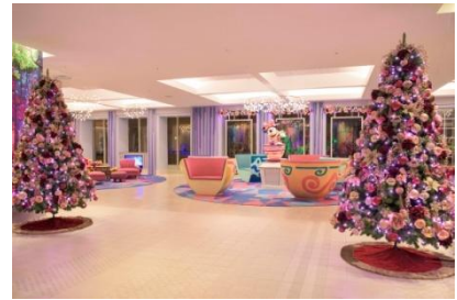
도쿄디즈니 셀러브레이션 호텔 위시의 데코레이션