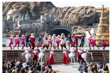
도쿄디즈니씨 ‘디즈니 크리스마스’

메디테라니언 하버에서는 디즈니 친구들이 선보이는 크리스마스 음악과 정통 라이브 퍼포먼스가 매력적인 하버 쇼 ‘잇츠 크리스마스 타임!’을 공연합니다. 가수가 부르는 노래에 맞춰 댄서들이 경쾌한 탭댄스와 아름다운 라인 댄스를 선보이는 이 레뷔쇼는 게스트 여러분을 화려한 도쿄디즈니씨의 크리스마스로 인도합니다.