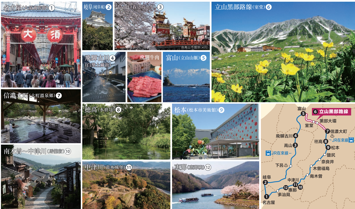
可搭乘的JR線、立山黑部 阿爾卑斯路線以及觀光地區的示意圖。記載的設施等可能需要另行支付入場費與交通費。