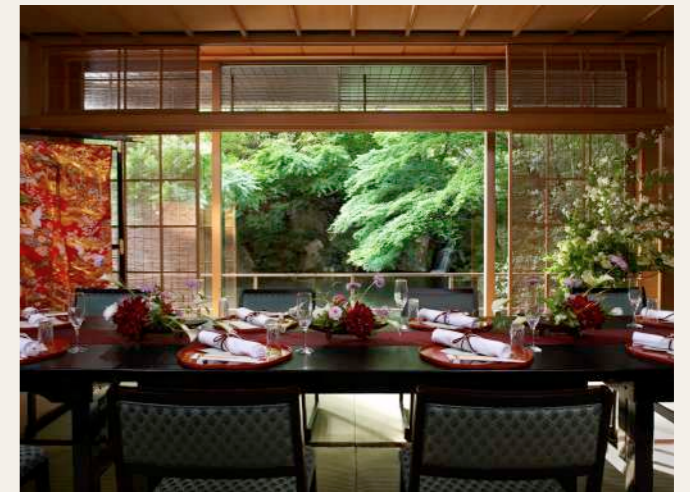
Ryotei Kinsui | 錦水