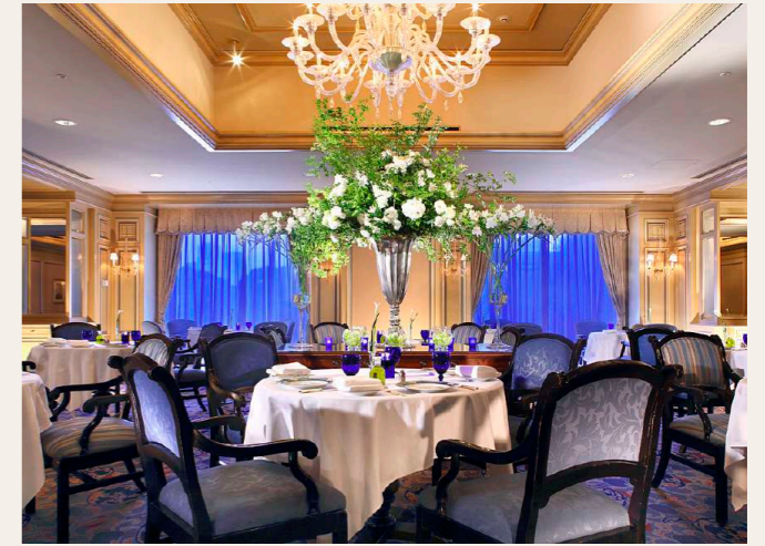
Il Teatro | イル・テアトロ