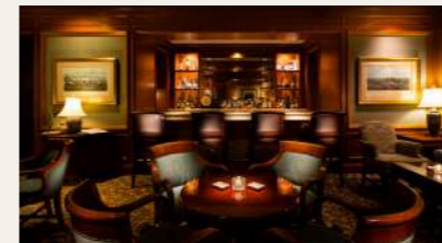
Le Marquis | ル・マーキー