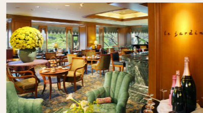
Le Jardin | ル・ジャルダン