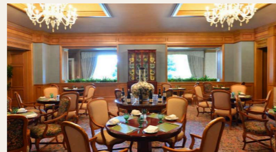
The Bistro | ザ・ビストロ