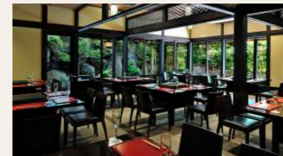
Mokushundo | 木春堂