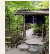
Mucha-an | 無茶庵